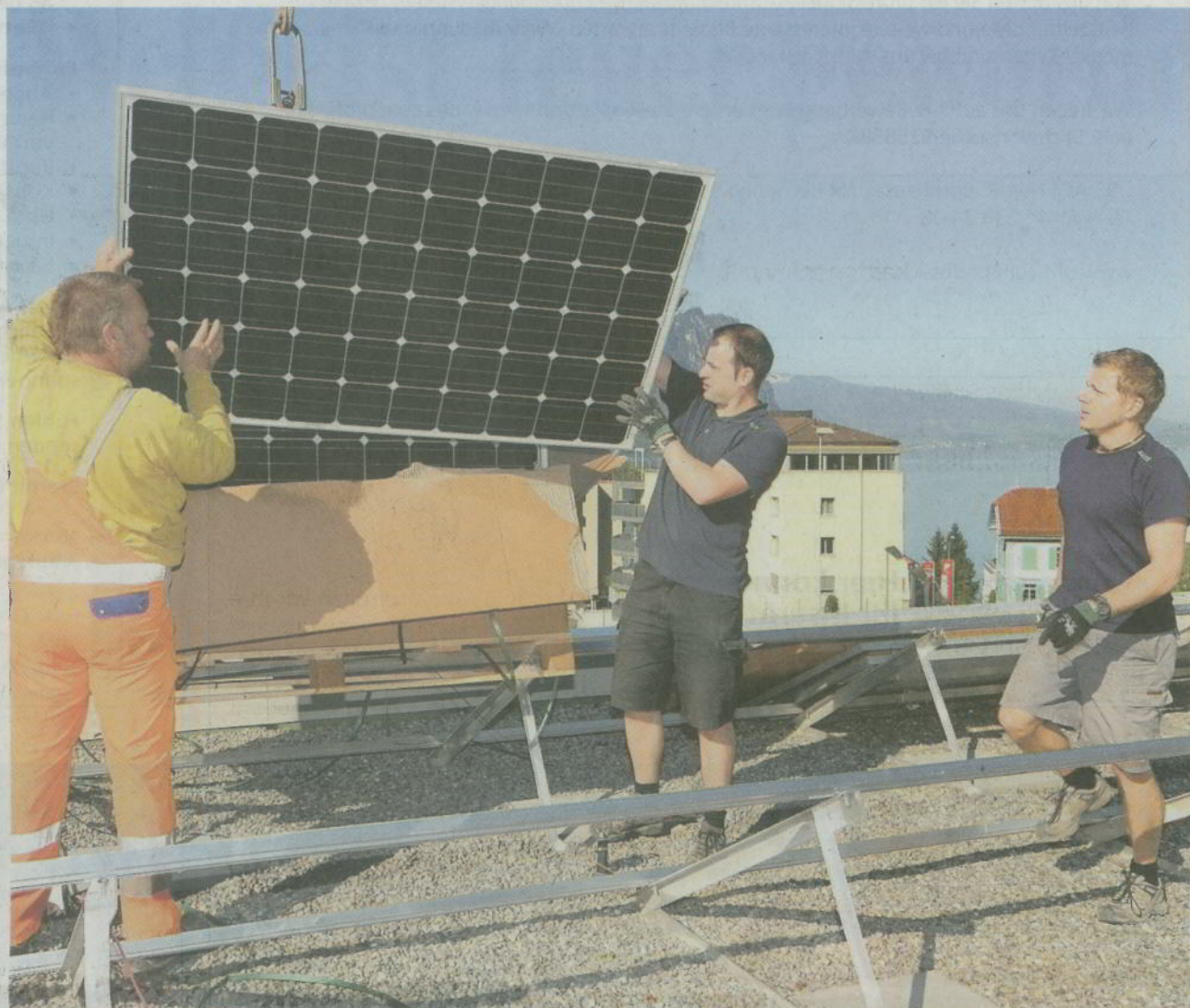
Fotovoltaik-Anlage installiert: In Vitznau wird Solarstrom nachhaltig produziert.

Während der Erneuerungsarbeiten am Schulhaus wurden im letzten Sommer die Modulträger durch die Fir- ma Labo GmbH auf die frisch sanierte Dachfläche montiert und nun, nach Fertigstellung der Elektrohaupt- leitungen, konnten auch die Module installiert und in Betrieb ge- nommen werden.